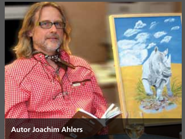
Autor Joachim Ahlers

Die Familie Greiss bedankte sich bei den Künstlern für ihr Kommen und ihr Engagement und lud das Publikum ein, auch bei den nächsten Veranstaltungen wieder mit dabei zu sein. Wer Interesse hat, ebenfalls mal vorbeizuschauen kann sich gerne in den Email-Verteiler ( kontakt@auto-greiss.de Stichwort: KulturGreiss) aufnehmen lassen um rechtzeitig informiert zu werden.