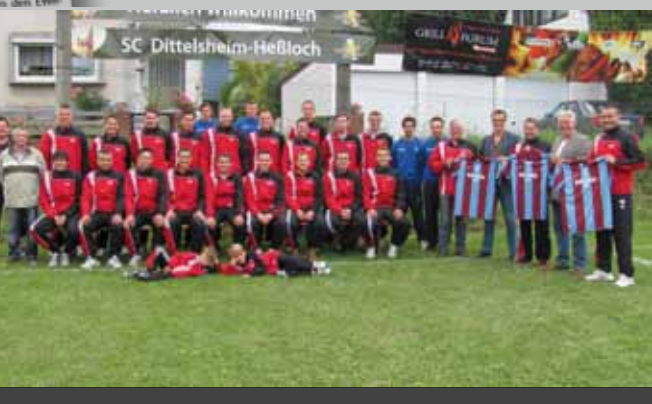
Die Mannschaft des SC Di-He bei der Trikotübergabe