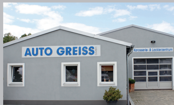
Karosserie- & Lackierzentrum in Dittelsheim-Heßloch

Natürlich kann man sich als Unternehmen nur dann so breit gefächert aufstellen, wenn man auch das entsprechende qualifizierte Personal dazu hat. Dies ist im Autohaus Greiss schon immer gegeben, die zum Teil langjährigen Mitarbeiter sind Spezialisten auf ihrem Gebiet, sind mit ihren Themen bestens vertraut und bilden sich auch immer wieder konsequent und mit Begeisterung fort.