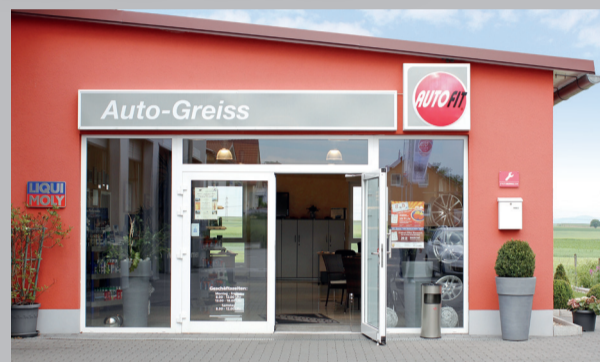
Fahrzeugservice & Fahrzeughandel in Westhofen

sowie an das Rangieren im Hof beim Ein- und Ausfahren zurück. Vergessen sind die alten Zeiten, wenn man heute ins Autohaus Greiss kommt. So erwartet die Kunden ein hochmoderner Betrieb, der von Reparaturen und Inspektionen über Ersatzteile bis hin zu einer Waschstraße und der Vermittlung von Neu- und Gebrauchtwagen – fast - alles zu bieten hat. Was das Autohaus alles für seine Kunden tut und macht stellen wir den Lesern einfach mal alphabetisch dar: