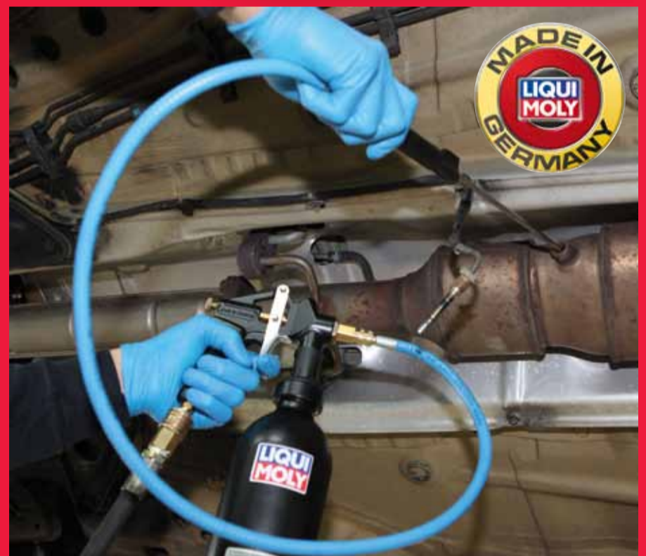
Anwendung der Dieselpartikelfilter-Reinigung

Weil ein neuer Filter mit mehreren tausend Euro zu Buche schlägt, wäre es lohnend, ihn manuell reinigen zu können. Daher hat LIQUI MOLY seinen Dieselpartikelfilter-Reiniger und seine Dieselpartikelfilter-Spülung entwickelt. Bei der Anwendung muss der Partikelfilter nicht ausgebaut werden, nur der Drucksensor wird entfernt. Durch die Öffnung wird die Sonde eingeführt und die Reinigungsflüssigkeit direkt in den Partikelfilter gesprüht. Die Wirkstoffe lösen den verkrusteten Ruß und werden mit der Spülung entfernt. „Inklusive der Wirkzeit des Reinigers dauert es höchstens eine Stunde, bis das Fahrzeug wieder von der Hebebühne runter kann. Danach muss das Auto oder der Transporter einige Zeit mit erhöhter Drehzahl gefahren werden, um den Reinigungszyklus zu aktivieren. So wird der angelöste Ruß verbrannt und der Filter wieder freigängig gemacht.